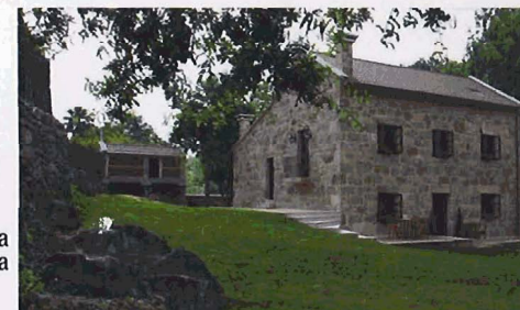
Casa da Muiñeira

sala para reuniones de empresa, un café-bar y un aparcamiento propio completan las instalaciones, situadas en una magnífica finca de 24.000 m 2 .