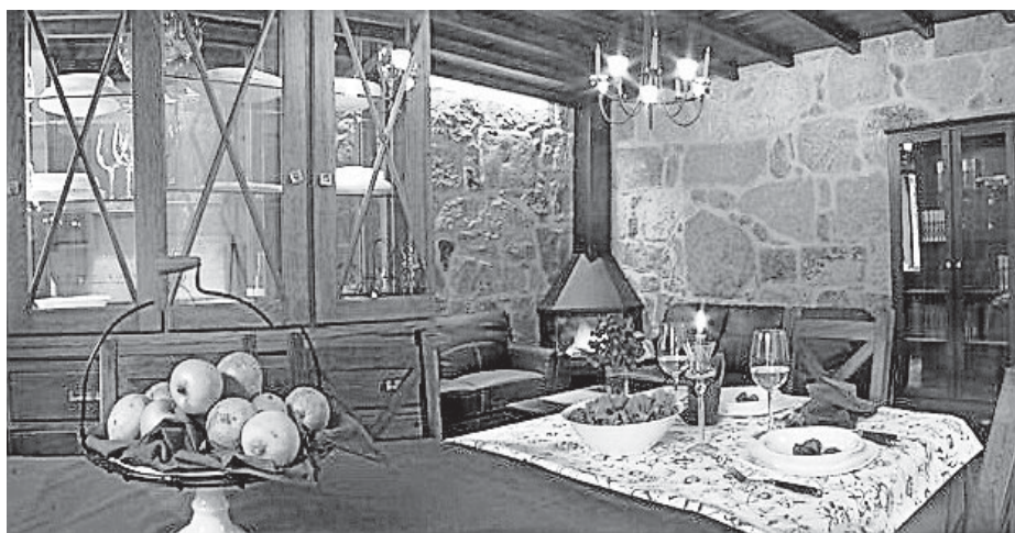
Una de las zonas comunes de la Casa da Muiñeira, que mezcla piedra y madera

Acaba de abrir sus puertas la Casa da Muiñeira, en la localidad cambadesa de Oubiña (A Belleira, 1), decorada con mucho gusto. Con cinco habitaciones dobles con baño, una de ellas adaptada a minusválidos y otra con cabina de hidromasaje y sauna, cuenta con una huerta de más de 2.000 metros cuadrados, por la que pasa un río que tiene a ambos márgenes dos molinos. Todo un paraíso.