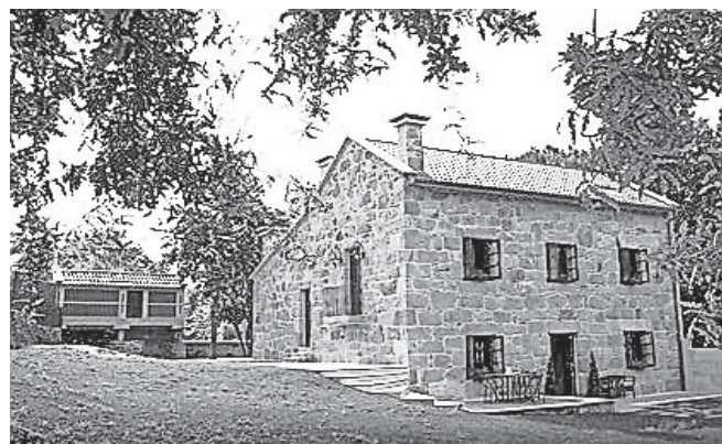
Fachada del nuevo establecimiento de turismo rural