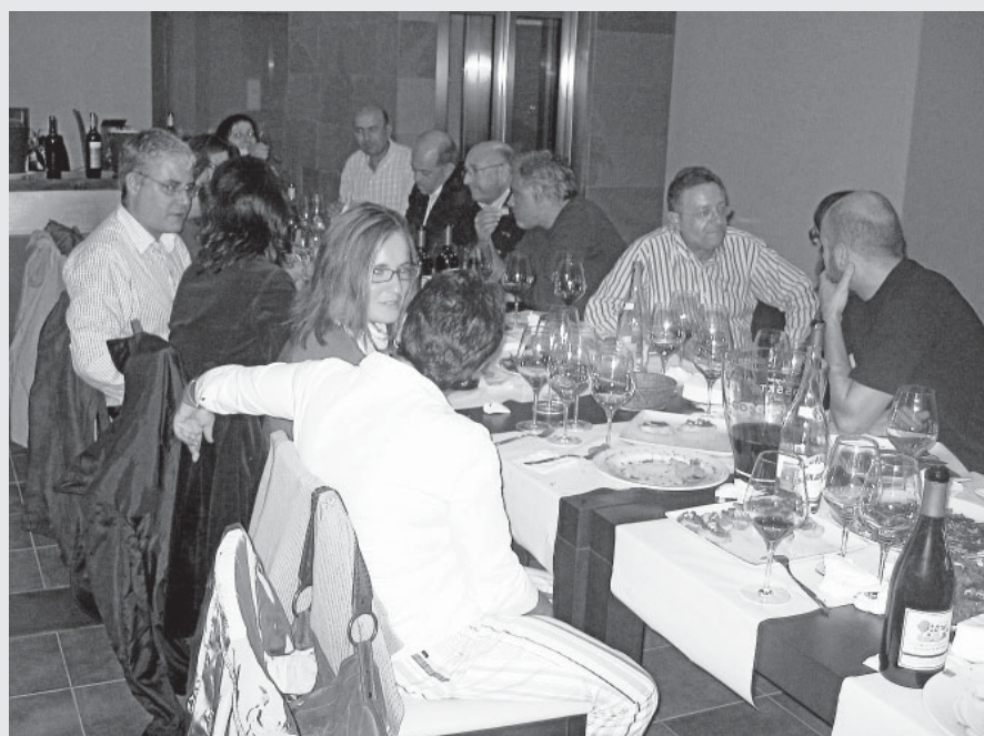
Asistentes a la cata en la vinoteca A Viña de Xabi, en la calle Fernando III el Santo