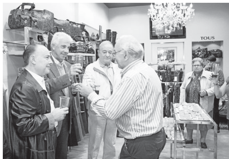
El padre de la propietaria, derecha, brindando con unos invitados