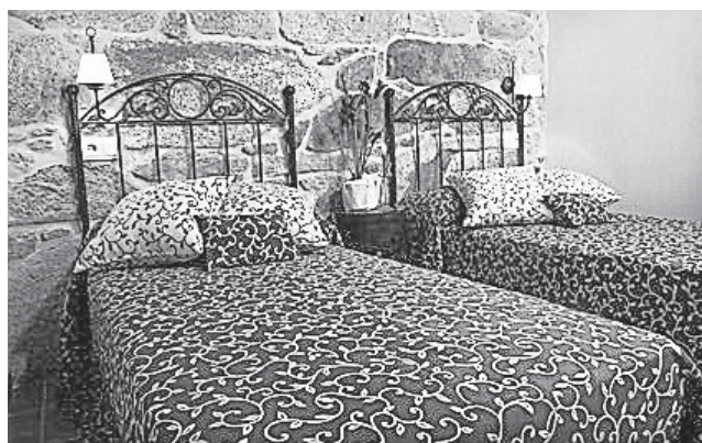
La forja tiene su sitio en alguna de las cinco habitaciones